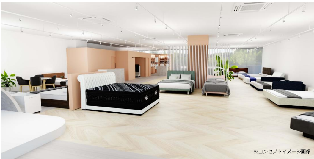
※コンセプトイメージ画像

ドリームベッド株式会社（本社：広島市西区、1950年創業、代表取締役社長：小出克己）は、「ドリームベッド 名古屋ショールーム」を、2024年6月7日（金）にリニューアルオープンします。リニューアルに伴い、東海エリア初のオーダーメイドマットレスの取り扱いを開始いたします。また、リン・ロゼ名古屋を併設いたします。寝室からリビング、家全体の「空環」をトータルコーディネートできる場として、お客様に快適で美しい暮らしを提供してまいります。